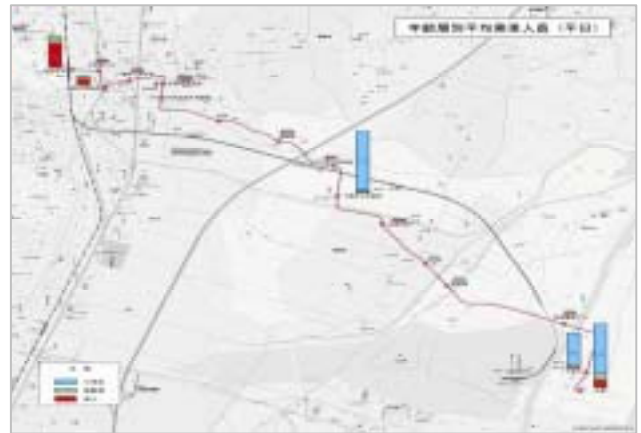
図6 停留所別年齢3区分別乗車人員

(1)と同様、北釜線の年齢3区分別乗車人員をみると、平均で、小学生が11.2人/日、高齢者が1.7人/日、成人が2.5人/日である。ほとんどが小学生の通学目的利用であることがわかる。(図6)