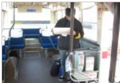
図7 調査員による乗降カウント

なお、GPS 乗降バスカウンターは、年齢階層(高齢者、成人、小学生)別乗降カウントと遅延時間データのみでの収集であり、運行ルート(バス停の設置位置変更を含む)の改善や運行時刻の改善などの改良につなげるためには、乗務員ヒアリングや利用者ヒアリングより得られた結果についても十分考慮する必要がある。